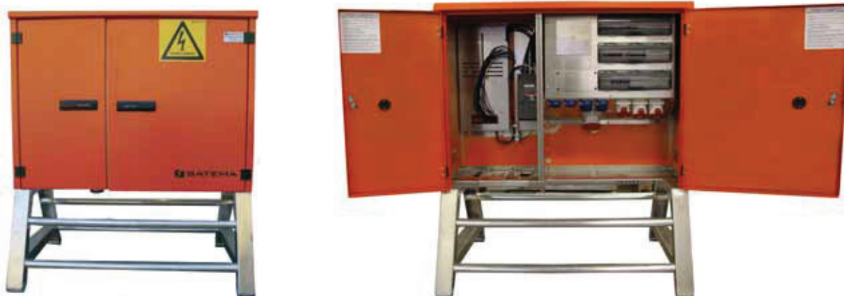
HS 125A/160A 230V