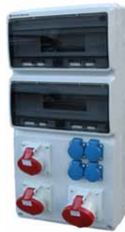
Eks. på kapslingstype