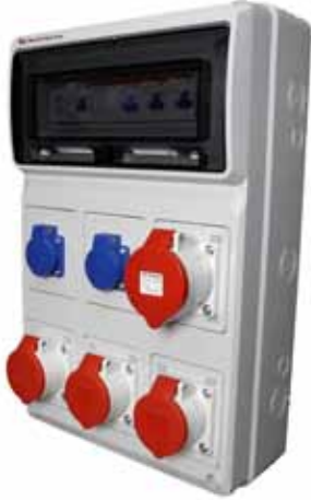
Eks. på kapslingstype